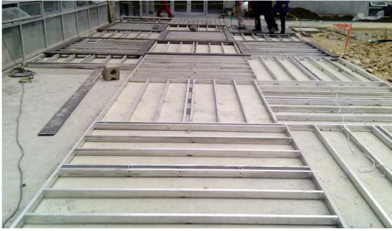
Soportes en aluminio para piso deck.