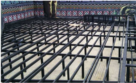
Estructura en acero estructural para piso deck.